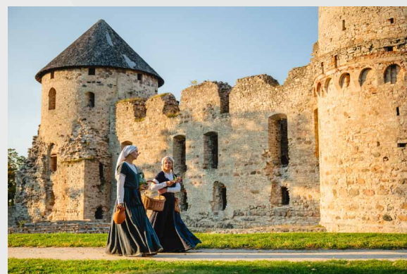
Cēsu Viduslaiku pils

16 | Cēsu Viduslaiku pils 17 | Cēsu Jaunā pils