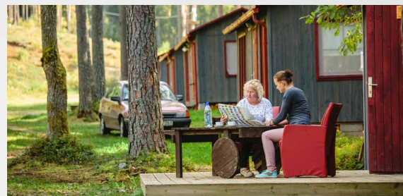
Atpūtas parks un kempings Ozolkalns