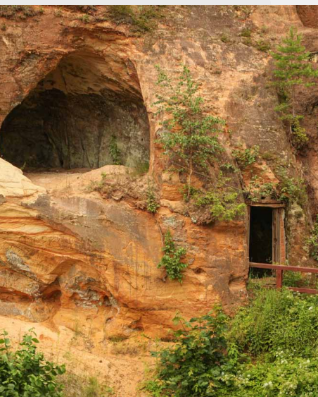
Līgatnes pagrabu alas